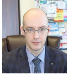
Гамаев Сергей Викторович к.м.н., главный внештатный специалист онколог Министерства здравоохранения Нижегородской области, главный врач ГБУЗ НО «НОКОД», г. Нижний Новгород